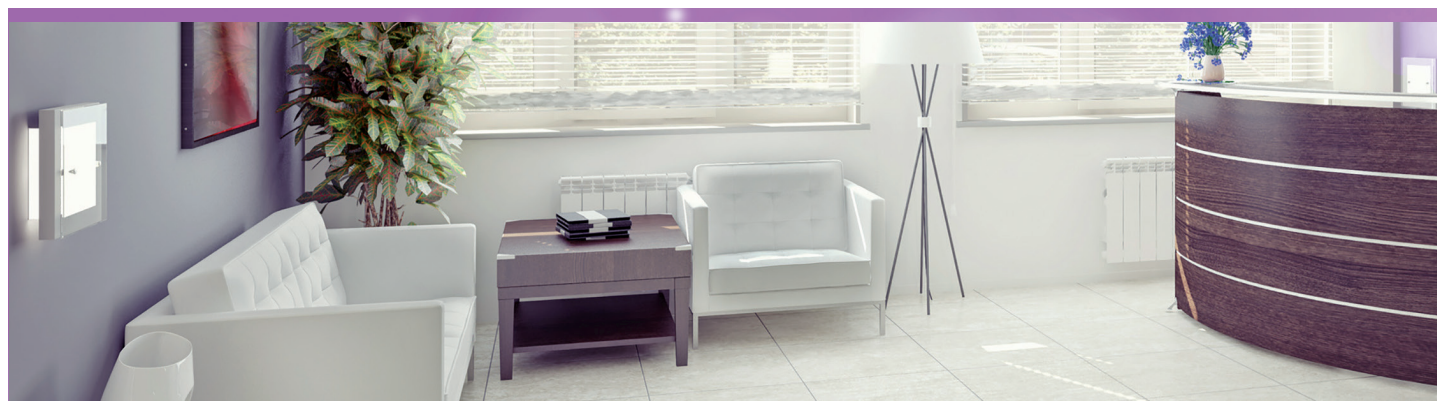
Citron vert, Pamplemousse, Ambiance, Lavande.

Dans tous les locaux où règnent des mauvaises odeurs : certaines sont communes (odeurs de toilettes, humidité, ou résultant d'une mauvaise aération), d'autres sont spécifiques, permanentes ou instantanées (restaurants, tabac, salles de sport, transports en commun).