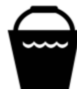
5L AQUA + 25ML