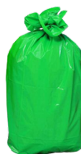
Sacs Verts Réf: 5440V