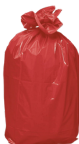
Sacs Rouges Réf: 5440R