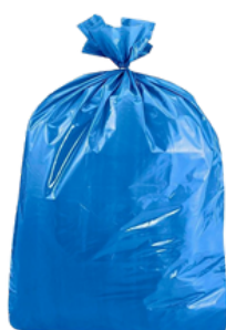
Sacs bleus Réf: 5440B